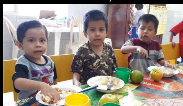
Vernieuwde comedor Enrique Bujold