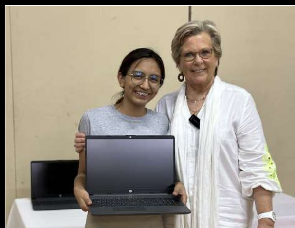
Laptops voor studenten